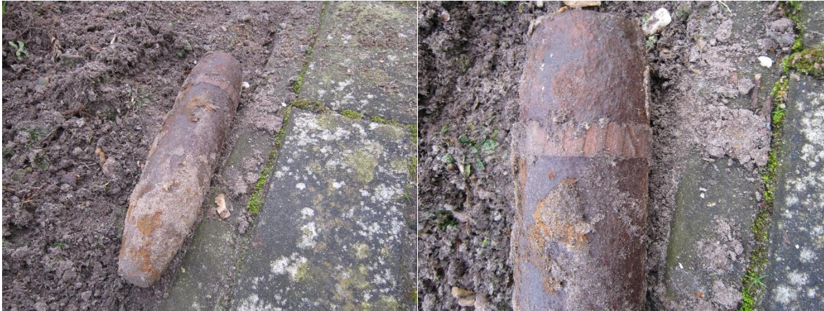
Het blijkt een redelijk gaaf exemplaar.

Dat verklaart waarom ik dit voorwerp, achteraf gezien, ontdekte na die strenge vorstperiode met sneeuwval begin februari. Zowel vorst als sneeuwval werkt in de grond. Hoewel de eerste gedachte tijdens het contact met wijkagente en EOD was, dat dit achtergebleven munitie uit WO2 zou kunnen zijn, konden zij daar geen sluitend bewijs voor geven. Dus heb ik zelf enig onderzoek gedaan.