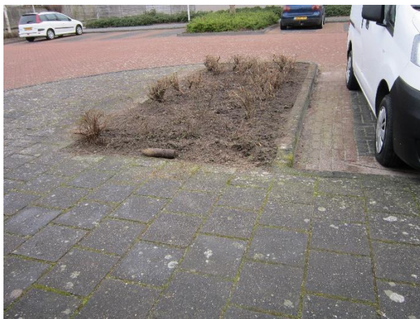
In de hoek rechtsvoor stak het voorwerp \pm 5 cm schuin uit vlak naast een struikje.

Al weken was ik dit voorjaar voorbij gelopen aan het perk vlak voor mijn huis met daarin een vreemd voorwerp. Het leek op de bovenste top van een paaltje o.i.d.. Omdat ik vaker zwerfvuil opruim rond huis of in de buurt, had ik sindsdien wel geprobeerd om dit even met mijn handschoenen aan te verwijderen. Daarbij bleek het zo vast te zitten, dat ik het gelaten had voor wat het was. Tot de gemeente dit perk op maandag 15 maart had geschoffeld en keurig aangeharkt en het voorwerp bleek te zijn achtergebleven. Resoluut zette ik er de volgende morgen de schop onder. En zo ontdekte ik hoe groot en zwaar dit voorwerp was: ruim 30 cm en 6 kilo!